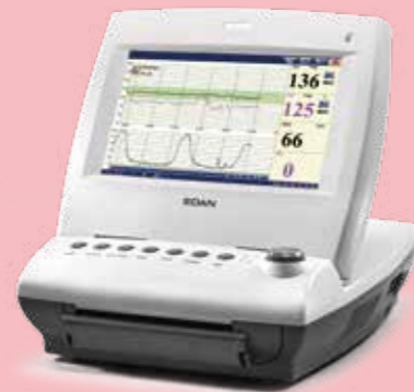
F6 Monitor Fetal & Maternal